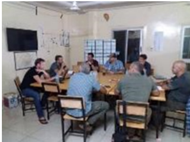
International Special Operations Liaison -meeting in Niger

In regio's waar een mogelijke inzet van Special Operations wordt verwacht, zou men het gebruik van een Special Operations Liaison Officer of team kunnen overwegen. België wenst, zowel in onze ruime omgeving als in de belangenzone van de EU en de NAVO, de veiligheid te versterken en wenst hiervoor, ook in het buitenland, een proactief beleid te voeren door risico's en bedreigingen zo vroeg en